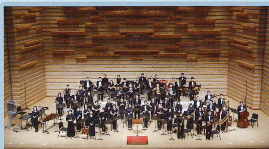
演奏 日本ウインドアンサンブル《桃太郎バンド》