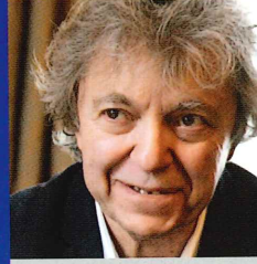
パスカル=ロジェ Pascal Rogé