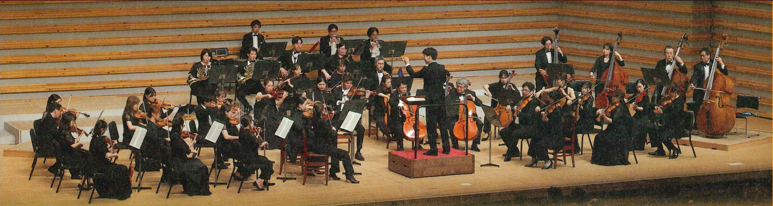
※豊中名曲シリーズ公演より