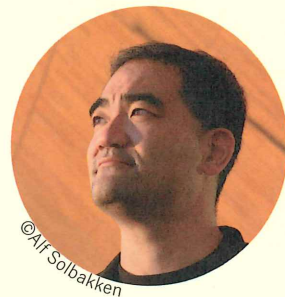
ふじくらだい 藤倉大 さん