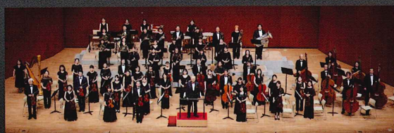
管弦楽：神戸フィルハーモニック