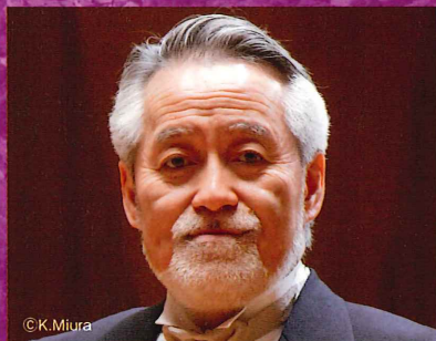
[指揮] 鈴木秀美 Hidemi Suzuki