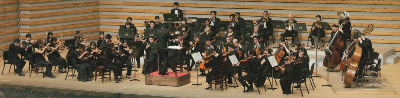
※豊中名曲シリーズ公演より