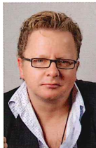
クラリネット ヴェンツェル・フックス