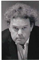
ヴィオラ ギャレス・ルベ