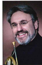
ホルン ヴァディム・ヴラトコヴィチ