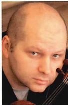
ヴァイオリン ボリス・プロフツィン