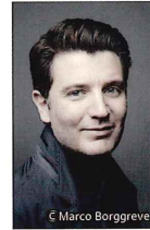
ピアノ アレッシオ・ボックス