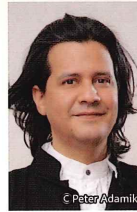
チェロ クラウディオ・ボルケス