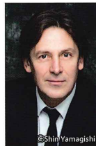
クラリネット ボル・メイエ