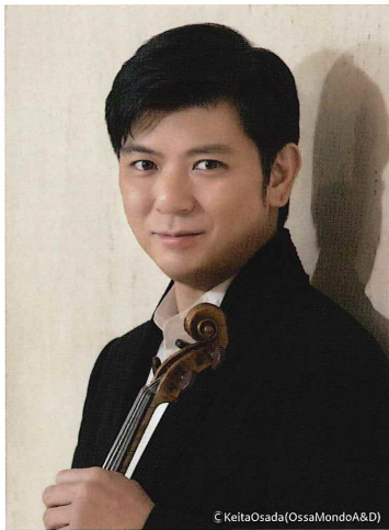
音楽監督/ヴァイオリン 樫本 大進