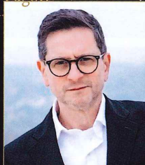
ローラン・ルフェーブル パリ国立歌劇場管弦楽団首席