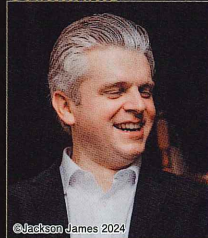
ラーシェ・カーリン デンマーク放送交響楽団ソロトロンボーン