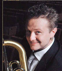
ステファン・ラベリ パリ管弦楽団ソロチューバ