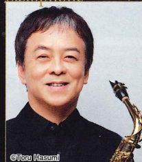
須川展也 東京藝術大学招聘教授