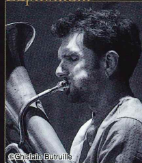
アントニー・カイエ ソリスト