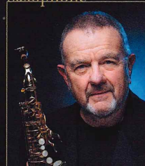
ジャンネイク・フルモー ソリスト