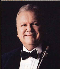
マイケル・コリンズ ソリスト、指揮者