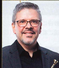
ロバート・サリバ ミシガン大学教授