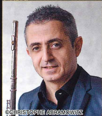
ミシェル・モラゲス フランス国立管弦楽団第二ソリスト