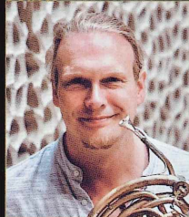
イェンス・ブリュッカー 北ドイツ放送エルブフィルハーモニー 管弦楽団首席