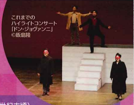
これまでのハイライトコンサート「ドン・ジョヴァンニ」

毎年大好評!この夏の芸術監督プロデュースオペラ『蝶々夫人』の見どころ、聴きどころが詰まったハイライトコンサート。「ある晴れた日に」などの名アリアをはじめ、オペラの魅力をギュッと集めた内容を、関西で活躍するオペラ歌手が歌い演じ、ピアニスト&名司会者の伊原さんの漫談!?のようなお話が会場を沸かせます。恒例の県内ツアーも敢行! さあ今年はこの街で楽しめますか?