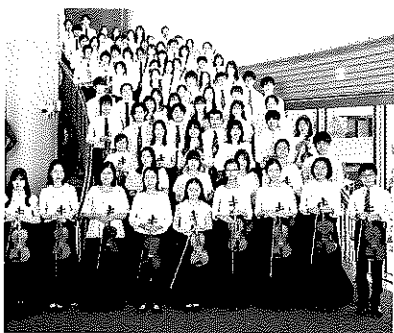
センチュリー・ユースオーケストラ [管弦楽] Century Youth Orchestra

桐朋学園大学指揮科卒業。ベルリン、ミュンヘンで研鑽を積み、これまでにフランクフルト放送響、ケルン放送響、チェコ・フィル、モスクワ放送響等に客演。01年、ドイツ・ヴュルテンベルク・フィルハーモニー管弦楽団音楽総監督(GMD)に着任し、日本ツアーも成功に導いた。国内では94年以來、東京交響楽団と密接な関係を続け、正指揮者、特別客演指揮者を歴任。06年度 芸術選奨文部科学大臣新人賞を受賞、07年より山形交響楽団音楽監督に就任、芸術総監督を経て、22年より同楽団桂冠指揮者。パシフィックフィルハーモニア東京音楽監督、日本センチュリー交響楽団首席指揮者、群馬交響楽団常任指揮者、いづみシンフォニエッタ大阪常任指揮者、東京佼成ウインドオーケストラ首席客演指揮者、中部フィルハーモニー交響楽団首席客演指揮者。 オフィシャル・ホームページ http://iimori-norichika.com/