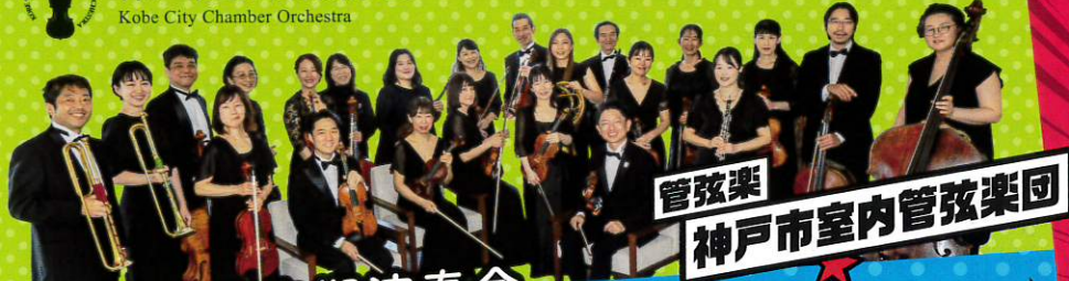
管弦楽 神戸市室内管弦楽団