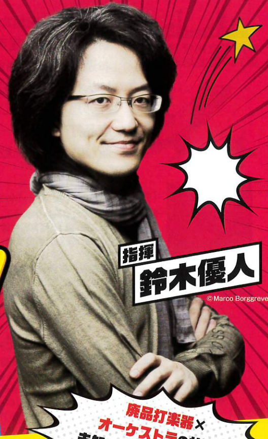
指揮 鈴木優人

廃品打楽器 × オーケストラの共演! 未知なる音色との出会いこそ、クラシック音楽の真髄だ!