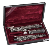
400シリーズ専用ケース OBC-430II