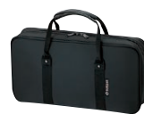
400シリーズ専用カバー OBB-430II

432も431と同様に、楽器作りに最適な状態のグラナディア材が使用されています。フル・オートマティックのオクターブ・キイシステムを備え、独特の抵抗感を持ち、広がりや豊かさの表現力に優れたその音色は、多くの演奏家たちに好まれています。正確なイントネーションと快適なレスポンス、均等のとれたバランスの良いモデルです。