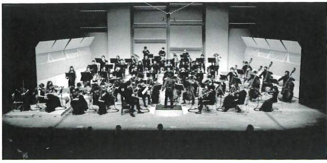
第13回定期演奏会 スマタナ「我が祖国」全曲(2022年2月20日、吹田市文化会館メイシアター)