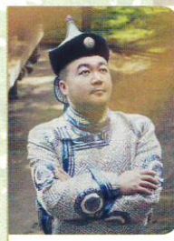
プロデュース、歌、笛 リュウイ

スーホの白い馬モンゴル楽団は2014年に大阪で設立され、その名のきっかけは日本の小学2年生の国語教科書に馬頭琴の由来である「スーホの白い馬」です。メンバーは内モンゴルカルチン、チョウダー、シンアン、シリンドルの各連合区出身。担当しているモンゴル音楽は、馬頭琴、トブショル、ホーミー、口弦、モンゴル長調、短調、モンゴル打楽器など。設立以来、日本の各学校や音楽会場で活動し、好評を博している。楽団はモンゴル音楽を発展させ、音楽とモンゴル文化を結合し、モンゴルの強い精神世界の起源を探究しています。モンゴル楽器を他の民族の音楽と融合し、音楽で文化交流を実現させています。馴染みのある楽曲の中でモンゴルの音楽と文化を感じてもらおうと共にモンゴルの情緒をお伝えしたいと思います。