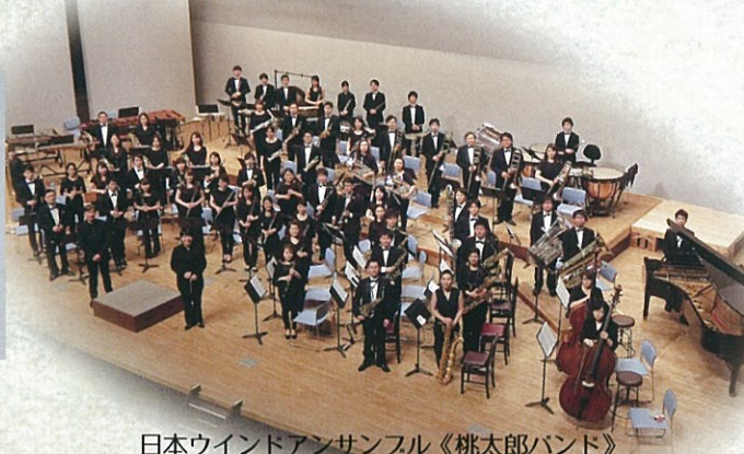
日本ウインドアンサンブル《桃太郎バンド》