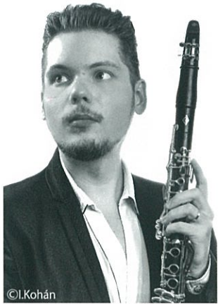
コハーン・イシュトヴァーン (クラリネット)

多くの国際コンクールで優勝・入賞を果たし、現在では日本を拠点に活躍するクラリネット奏者コハーン・イシュトヴァーンさんとNHK-FM「リサイタル・パッショ」の支配人やアウトリーチなど活躍目覚ましい人気ピアニスト金子三勇士さんは共にハンガリーで学んだ盟友。サン＝サーンス、ガーシュウインの名曲を始め、自作曲、そしてピアノソロもありの贅沢プログラム。色彩豊かな表現力と巧みな超絶技巧が華やぐデュオ競演にご期待ください。