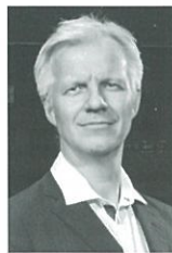
オイヴィン・ギムゼ (チェロ) Øyvind Gimse, Cello

中村太郎、鈴木鎮一、宗倫安各氏に師事。桐朋学園音楽大学卒業後、ウィーン国立音楽大学でEdith Steinbauer, Franz Samohyl, 室内楽をAlfred Staar各氏に師事、同大学を最優秀で卒業。1971年ハイドン国際室内楽コンクール第1位、J.S.バッハ国際コンクールヴァイオリン部門特別賞受賞。ニュールンベルク響、ミュンヘン室内合奏団を経て76年から2010年までバイエルン放送交響楽団第一ヴァイオリン奏者。18年3月まで東京音楽大学にて室内楽、オーケストラの客員教授を務めた。