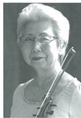
水島 愛子 (ヴァイオリン) Aiko Mizushima, Violin

京都市立芸術大学卒業。故レナード・バーンスタイン、小澤征爾らに師事。1989年プザンソン国際指揮者コンクール優勝。パリ管弦楽団、ベルリン・ドイツ交響楽団、ケルンWDR交響楽団、ベルリン・フィルハーモニー管弦楽団等、欧州の一流オーケストラに多数客演を重ねている。2015年9月トーンクンストラ管弦楽団音楽監督に就任。国内では兵庫県立芸術文化センター芸術監督、シエナ・ウインド・オーケストラの首席指揮者を務める。18年5月にトーンクンストラ管弦楽団を指揮した10枚目のCD「バーンスタイン：交響曲第3番<カディッシュ>/弦楽のためのセレナード」を2018年12月にリリース。著書に「僕はいかにして指揮者になったのか」(新潮文庫)、「棒を振る人生～指揮者は時間を彫刻する～」(PHP文庫)等。http://yutaka-sado.meetsfan.jp