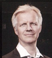
チェロ オイヴィン・ギムゼ