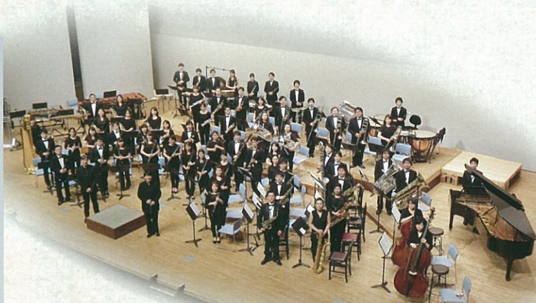
日本ウインドアンサンブル《桃太郎バンド》