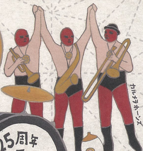
カルメラホーンズ