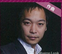
作曲 酒井 健治 Kenji Sakai