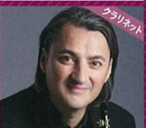
クラリネット フローラン・エオー Florent Héau