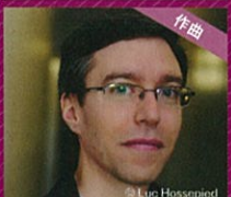
作曲 イヴ・ショリス Yves Chauris