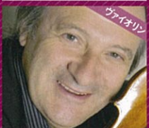
ヴァイオリン レジス・パスキエ Régis Pasquier