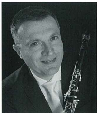
Varga Gábor ヴァルガ・ガーボル(クラリネット)

1974年ハンガリー共和国生まれ。1998年ハンガリー国立リスト音楽院クラリネット科卒業。在学中の1997年よりハンガリー放送交響楽団首席クラリネット奏者を務め現在に至る。これまでに、ドナホーニ賞、ハンガリーラジオニーボー賞受賞。フィッシャー・アンネ奨学金、ハンガリー政府よりエドヴァシュ奨学金を授与。第10回スペイン・セヴィリア国際クラリネットコンクール1位。その後はフィンランド・スロヴァキア・ルーマニア・フランス・スペイン・台湾・中国など世界中の音楽祭やマスタークラス、ゲストソリストとして迎えられており、特にウィーン学友協会やゲヴァントハウス(ドイツ)でのリサイタルは高い評価を得た。また2005年より2年間はシンガポール交響楽団客員第1クラリネット奏者としても活動した。ハンガリー人作曲家によるクラリネット作品の初演も多く、コヴァーチ・ゾルターン「夢の踊り」、デュルコー・ペーテル「2つの協奏曲」、ヴァイダ「クラリネット交響曲」などがあり、ソリスト・室内楽奏者としてハンガリー音楽界では欠かせない存在となっている。また現在はヴァルガ・ティボール音楽研究所、デブレツェン大学音楽科にて後進の指導に当たり、指導者としても高い評価を受けている。